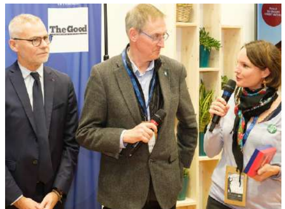
Remise du trophée Argent du Grand Prix des Alliances Durables le 19 novembre 2024

Cette initiative a été récompensée le 19 novembre dans le cadre du Grand Prix The Good des Alliances Durables lors du Salon des Maires et des Collectivités Locales.