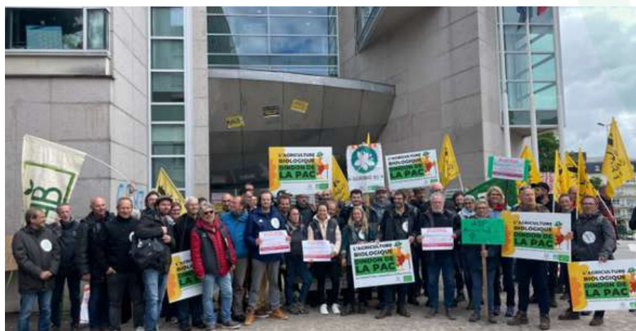
Manifestation organisée par Bio Centre devant l'ASP en mai 2024.

Ce délai d'un an restera dorénavant un marqueur pour l'administration qui ne pourra plus se défausser. En 2024 le réseau FNAB s'est donc mobilisé, craignant de nouveaux délais excessifs dans le paiement des aides bio. La FNAB a mis à disposition du réseau des kits juridiques permettant aux agriculteurs de faire valoir rapidement leurs droits si le paiement n'était toujours pas effectué un an après la déclaration. 95% des aides bio avaient finalement été versés fin juillet.