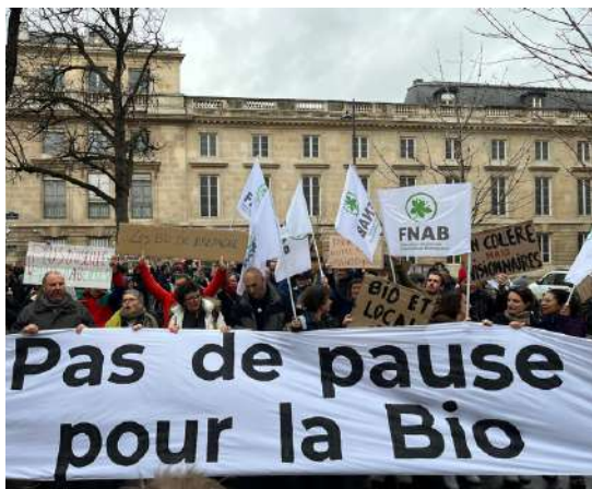
Mobilisation devant l'Assemblée Nationale le 7 février 2024

La crise de la consommation commencée en 2022 perdure et la situation des fermes bio, en particulier dans certaines filières, continue de s'aggraver. La FNAB a redoublé d'efforts pour défendre le revenu des agriculteurs bio pour leur permettre de maintenir leur activité.