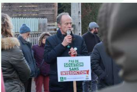
Mobilisation devant la DDT d'Auxerre le 28 novembre 2024

Le réseau bio et Générations futures ont lancé des recours juridiques pour faire interdire cette dangereuse molécule. La FNAB a lancé une cagnotte pour financer ces poursuites.