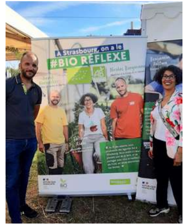
Lancement de la campagne "A Strasbourg, on a le #Bioreflexe" le 6 septembre 2024 lors du passage du Bio Tour

Par ailleurs, la FNAB participe activement, aux côtés de l'Agence Bio et des interprofessions, au comité de pilotage de la prochaine version de la campagne #BioRéflexe dont le lancement est prévu en février 2025 à l'occasion du Salon International de l'Agriculture.